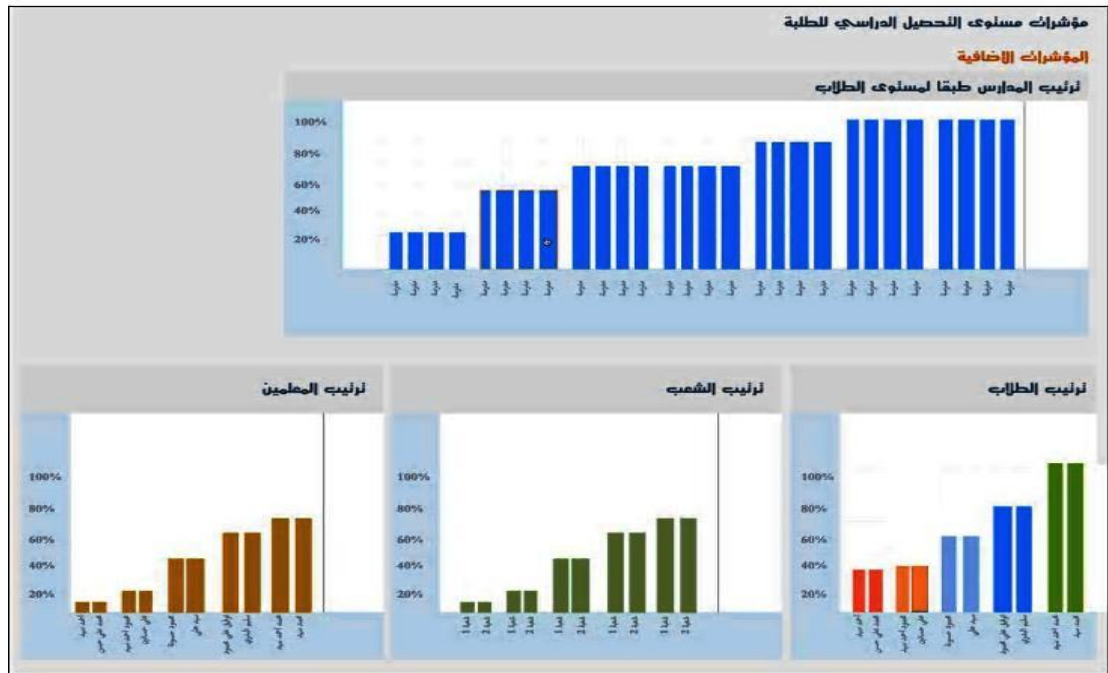
الشكل (٣) نافذة مؤشرات الإضافية للتحصيل الدراسي في البوابة التعليمية

أما المؤشرات التربوية الإضافية تكون مرتبطة بالمؤشر الرئيسي وبالمحددات ولكنها تظهر في صفحة منفصلة؛ ذلك لصعوبة عرضها في صفحة المؤشر الرئيسي، وهي تمثل طريقة أخرى في عرض بيانات المؤشر، إما لاختلاف طريقة التصنيف أو الترتيب، مثال في مؤشر التحصيل الدراسي للطلبة يمكن اختيار عينة من فئة الطلاب التي لها المستوى (هـ) ثم عرض مؤشر إضافي يوضح مدارس الطلاب مرتبة بالمستوى، ويمكن ربط هذا المؤشر الإضافي بمؤشرات فرعية خاصة به، مثل اختيار مجموعة من المدارس واستعراض الشعب أو الطلاب فلها (١) ؛ وذلك كما يوضح الشكل التالي رقم (٣).