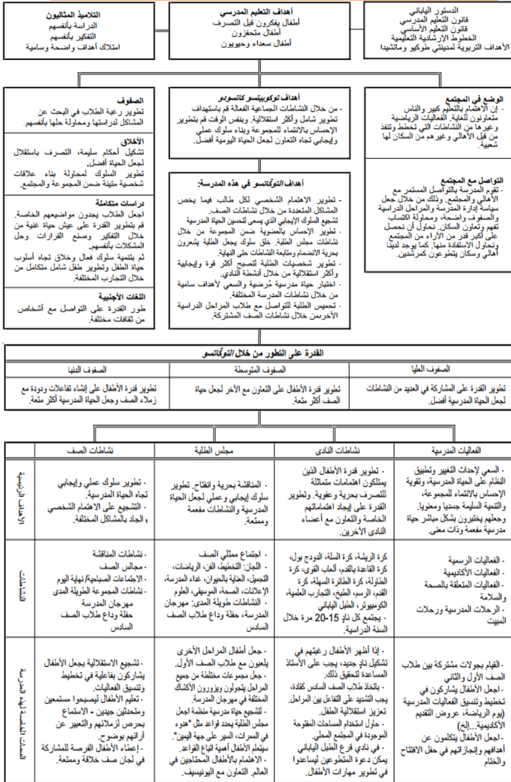
شكل رقم (1) يوضح الخطة الإجمالية لأنشطة التوكاتسو اليابانية